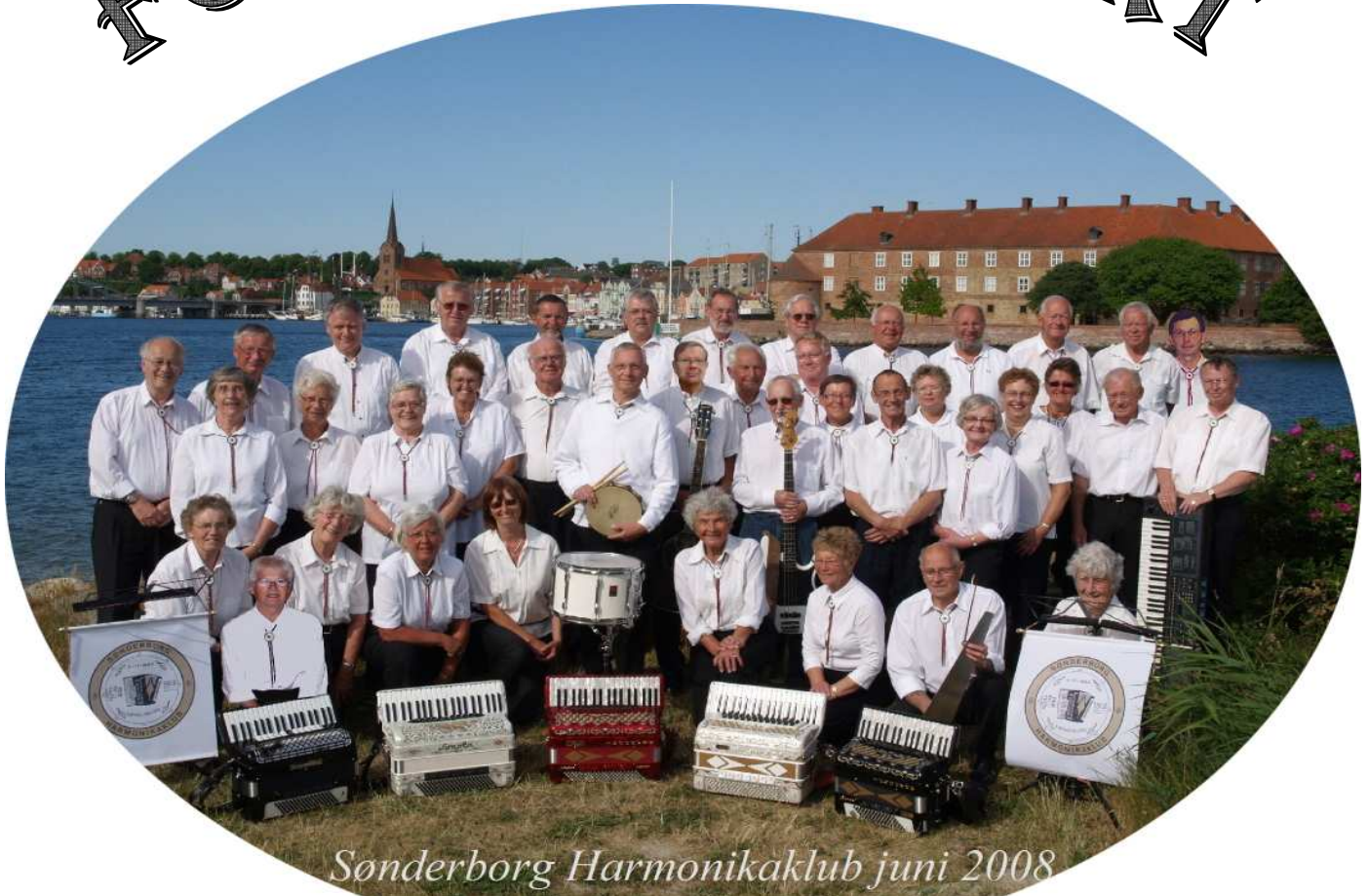
Sønderborg Harmonikaklub juni 2008